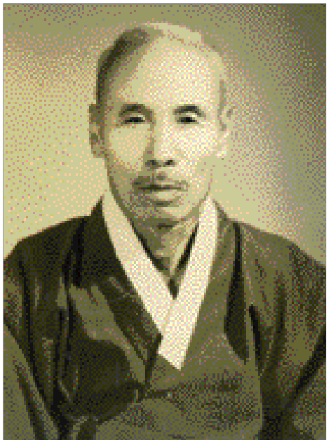
三娶 宜人 一善金氏 1 1